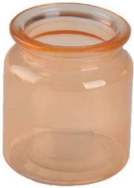
pemegang lilin kaca