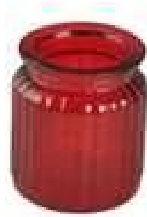
semburan lilin kaca jar