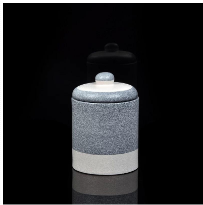
tangan yang dibuat pemegang lilin seramik