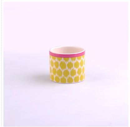
lukisan berwarna-warni pemegang lilin seramik