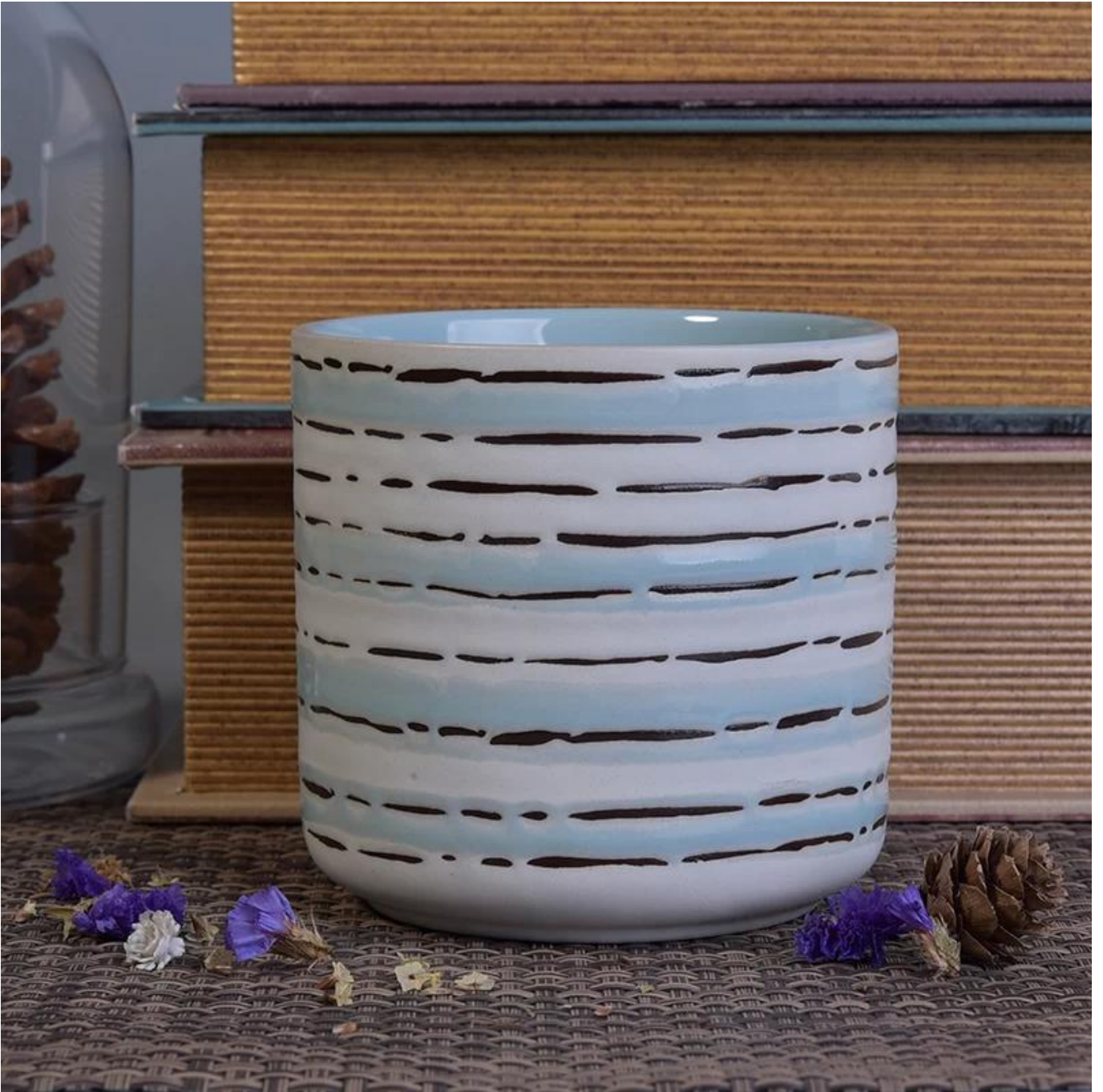
Aksesori yang anda inginkan: