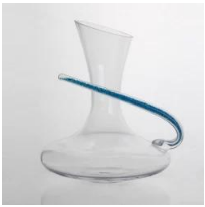
Tangan Reka bentuk yang unik wain ditiup botol