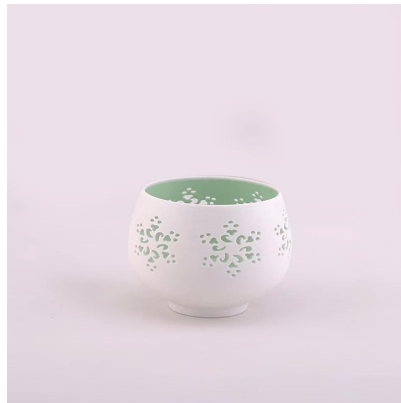
tangan yang dibuat pemegang lilin seramik