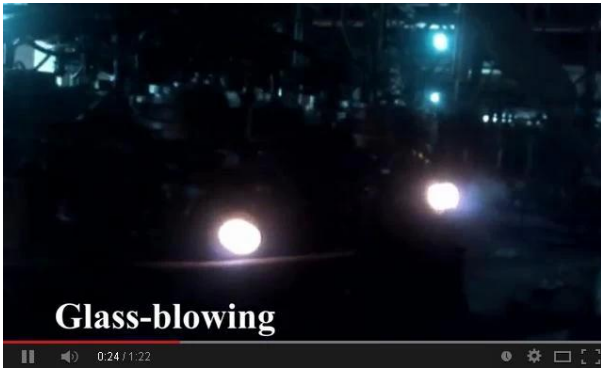
Mesin Kaedah Blown