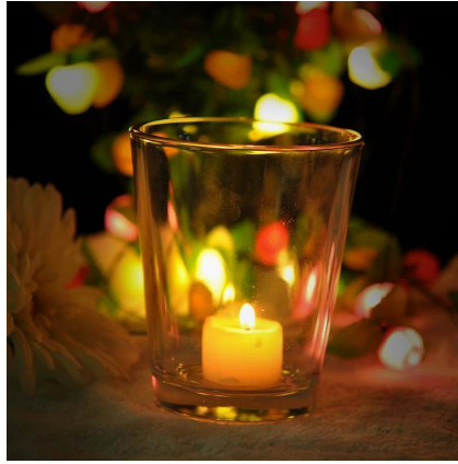
V Shape tinggi pemegang lilin yang jelas