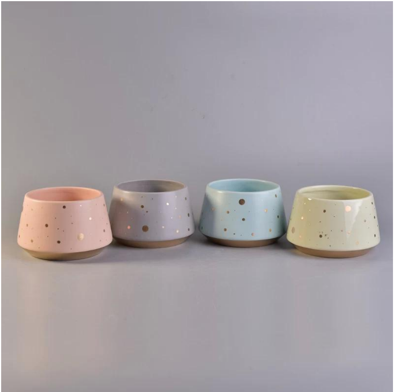
Aksesori yang dipadankan: