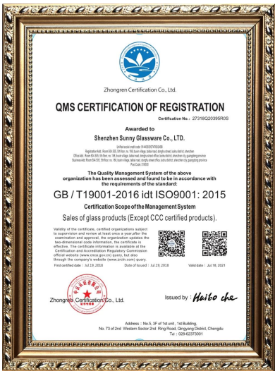
ISO 9001: 2015