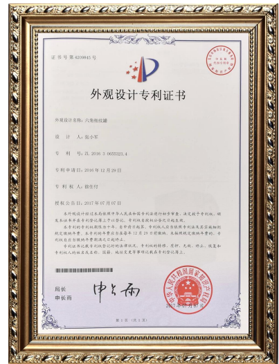
No. paten: 201630655323.4