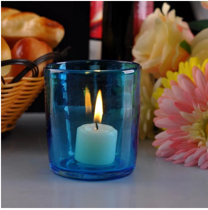
berwarna pemegang lilin kaca