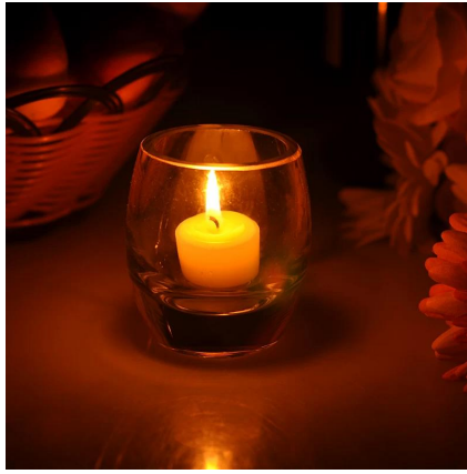
pemegang lilin nazar jelas