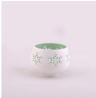
tangan yang dibuat pemegang lilin seramik