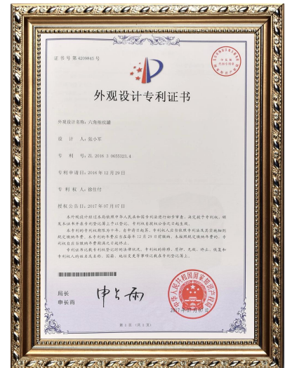
Paten no.: 201630655323.4