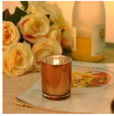
140ml Tembaga Lilin Jar