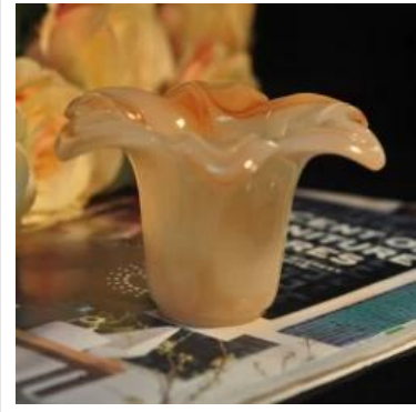
Bunga bentuk silinder jed amber warna kaca hiasan pemegang lilin lilin balang