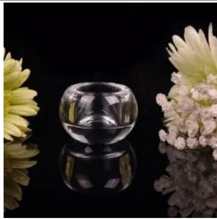
Pusingan pemegang Tealight kecil