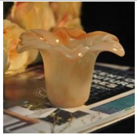
._bentuk bunga ambar berwarna silinder jed kaca hiasan lilin pemegang balang lilin