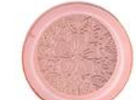
Zinc alloy embossed