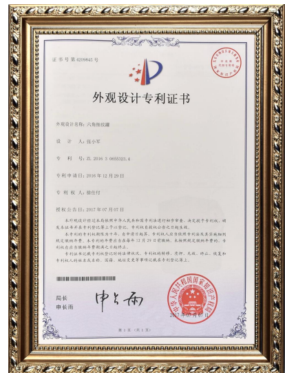
Brevetto n. 2.201630655323.4