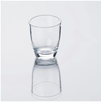
tiro a forma di vetro