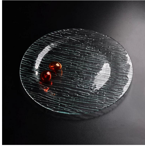
rotonda lastra di vetro chiaro