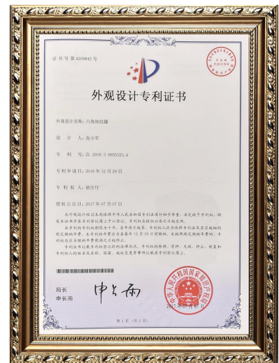
Brevetto n. : 20163065532.4