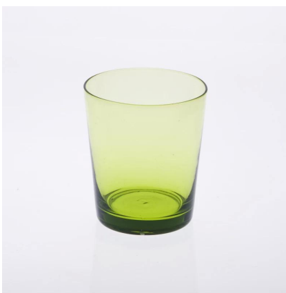
spruzzare portacandele colorati