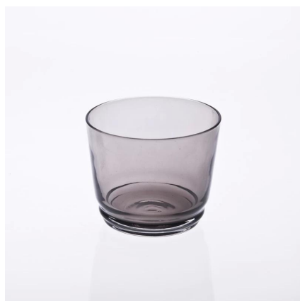
portacandele di vetro