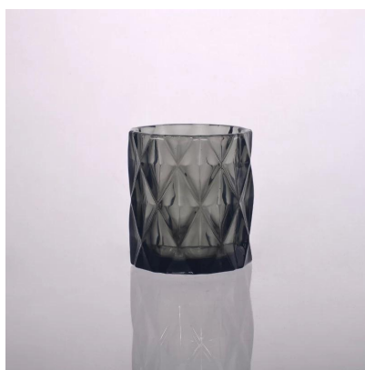
Candelabri in vetro diamantato tinta unita