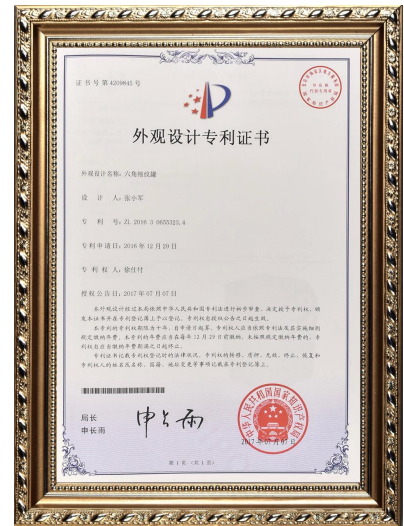
Brevetto n.: 201630655323.4