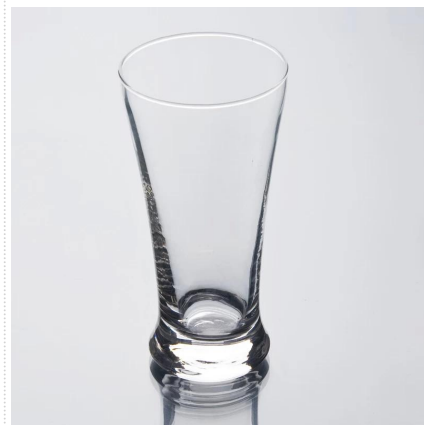
Macchina bicchiere in vetro soffiato