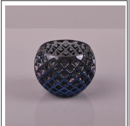
vetro portacandele tessuti modello