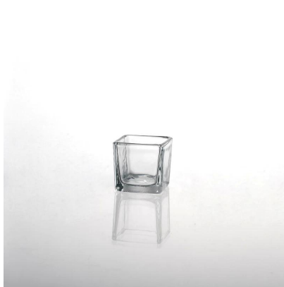
titolare quadrata netta di candela di vetro