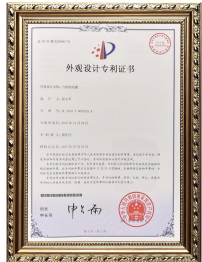
Brevetto no. : 201630655323.4