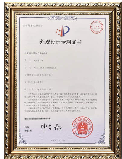
Brevetto n. : 201630655323.4