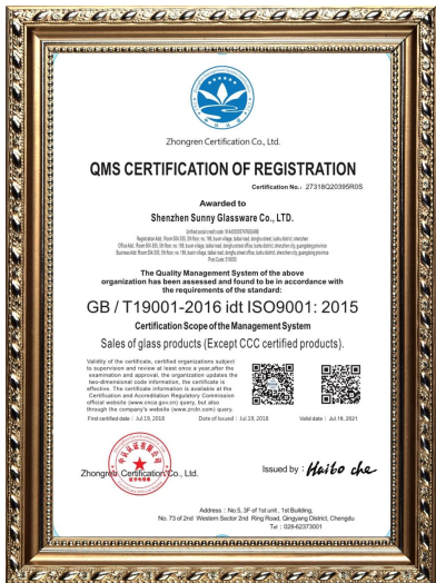
ISO 9001: 2015