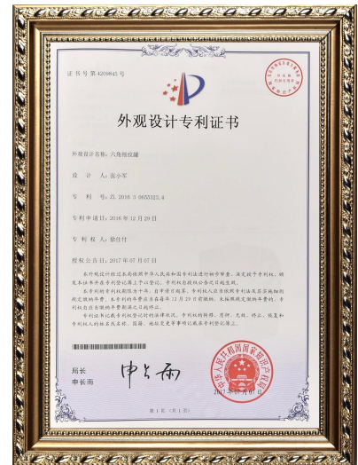
Brevetto n.: 201630655323.4