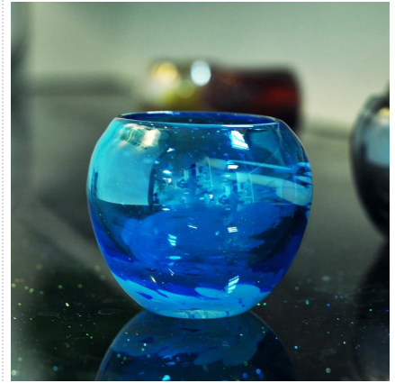
nuovo portacandele di vetro fatti a mano arrivo