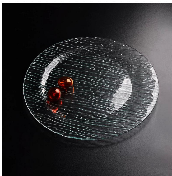
rotonda lastra di vetro chiaro