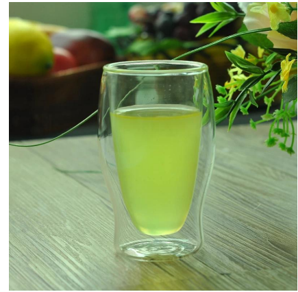
150ml 250ml 350ml 450ml borosilicato a doppia parete bere bicchiere