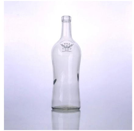
bottiglia di whisky vetro di grandi dimensioni