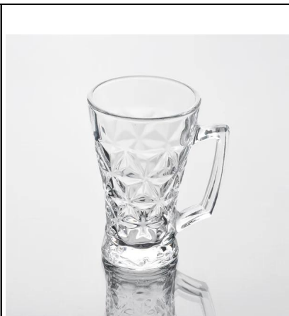
macchina fatta di vetro di birra