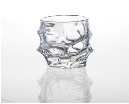
candela decorazione del vetro titolare