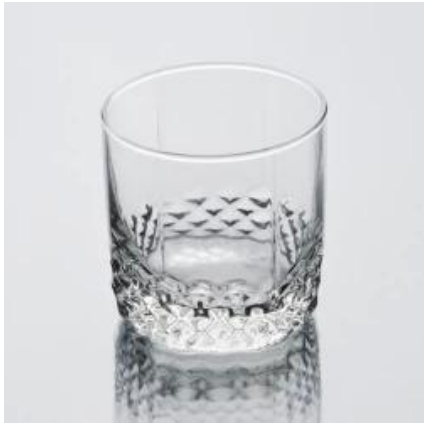
tazza di vetro inciso