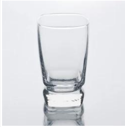
ultima tazza di vetro di design_