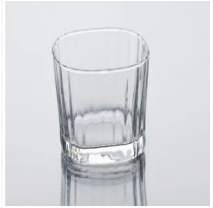
tazza di acqua buon bicchiere

S Our Company & Sample Room Every day is sunny day