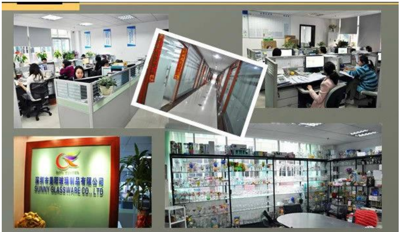
Spettacolo di fabbrica: