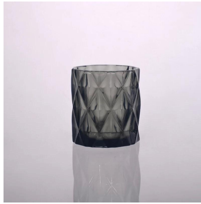
candeliere di vetro diamante in colore solido