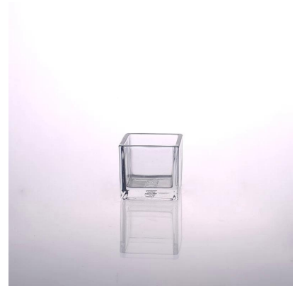
supporto della candela quadrata di vetro della decorazione domestica