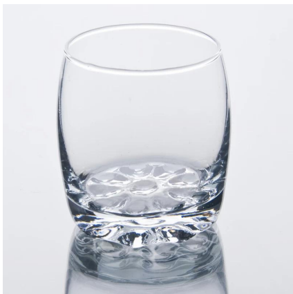
macchina di vetro soffiato