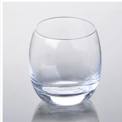
trasparente in vetro soffiato macchina