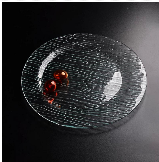
rotonda lastra di vetro chiaro