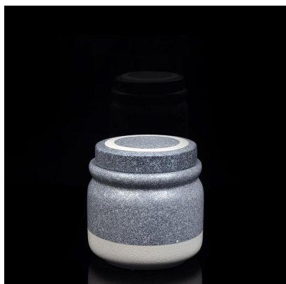
Portacandele in ceramica con finiture in marmo