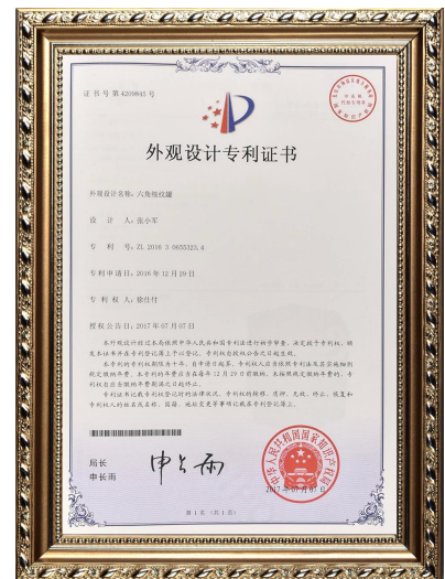
Brevetto n. : 201630655323.4