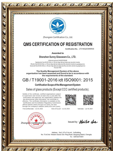
ISO 9001: 2015