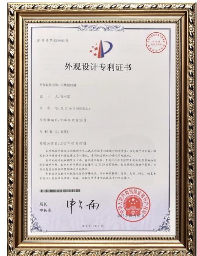
Brevetto n. : 20163065532.4