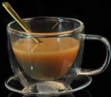
Double Wall Glass