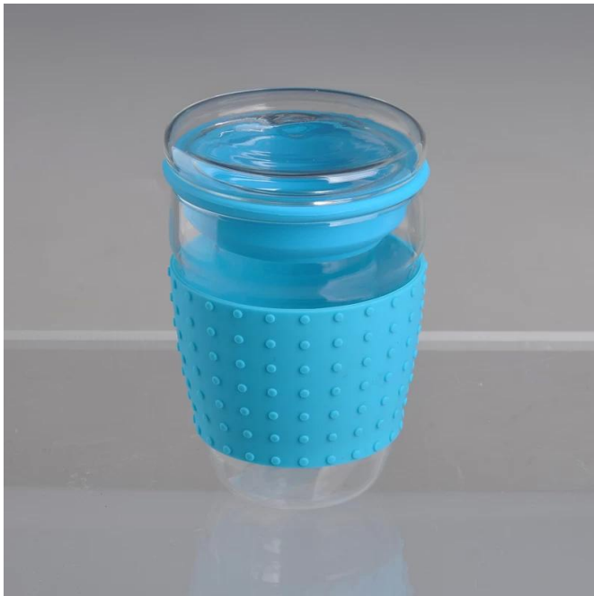
borosilicato tazza di vetro con silicane