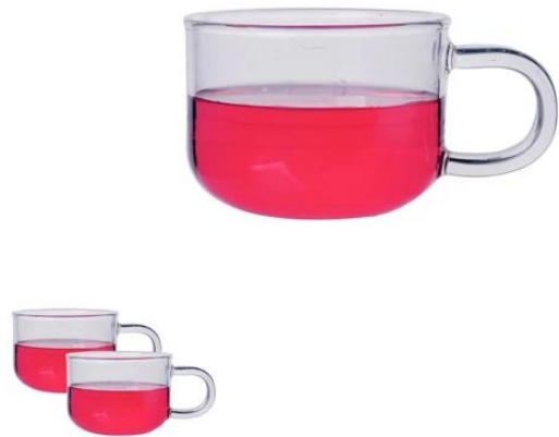
vetro borosilicato a parete singola