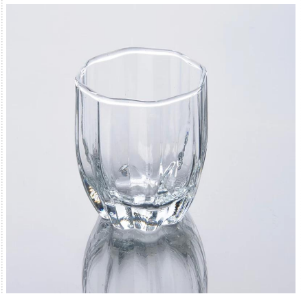
vetro promotioanal popolare