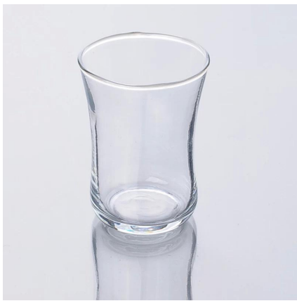
lastest tazza di vetro desgin