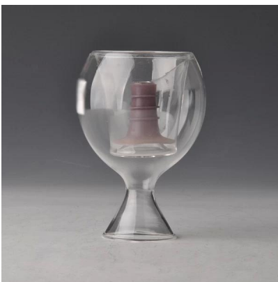
tazza di vetro borosilicato speciale