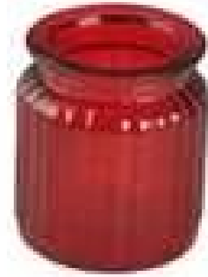
spruzzo di vetro candela jar