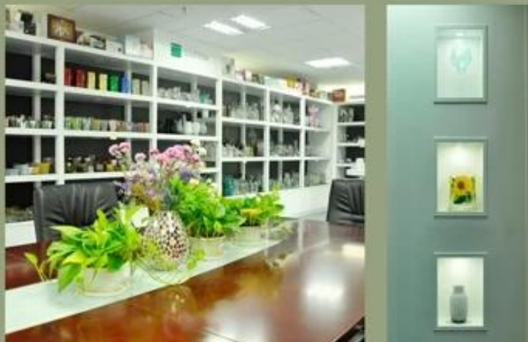
Mostra di fabbrica: