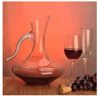
Qualità del vino soffiato a mano decanter