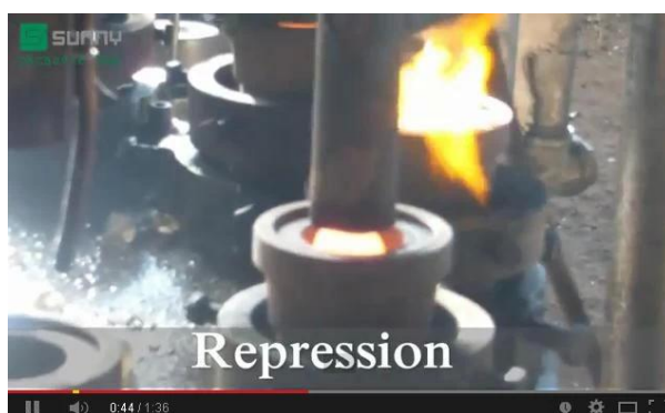
Tecnologia di presse meccaniche