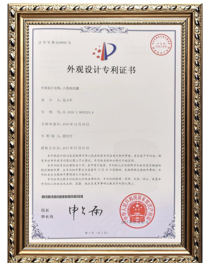
Brevetto n. : 201.630.655.323,4